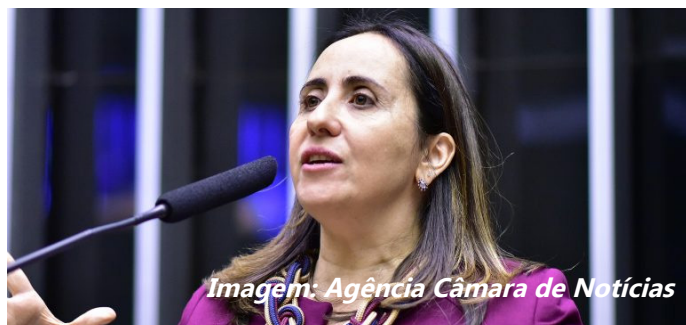
Imagem: Agência Câmara de Notícias

A Câmara dos Deputados aprovou, dia 17, projeto de lei que permite aos estabelecimentos comerciais tornarem disponível aos clientes cópia em meio eletrônico ou digital do Código de Defesa do Consumidor (CDC). Texto revoga a lei que exige a manutenção de cópia impressa do CDC nos estabelecimentos comerciais.